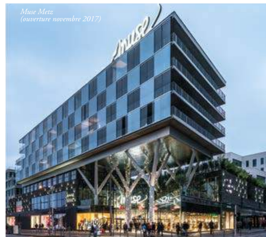
Muse Metz (ouverture novembre 2017)