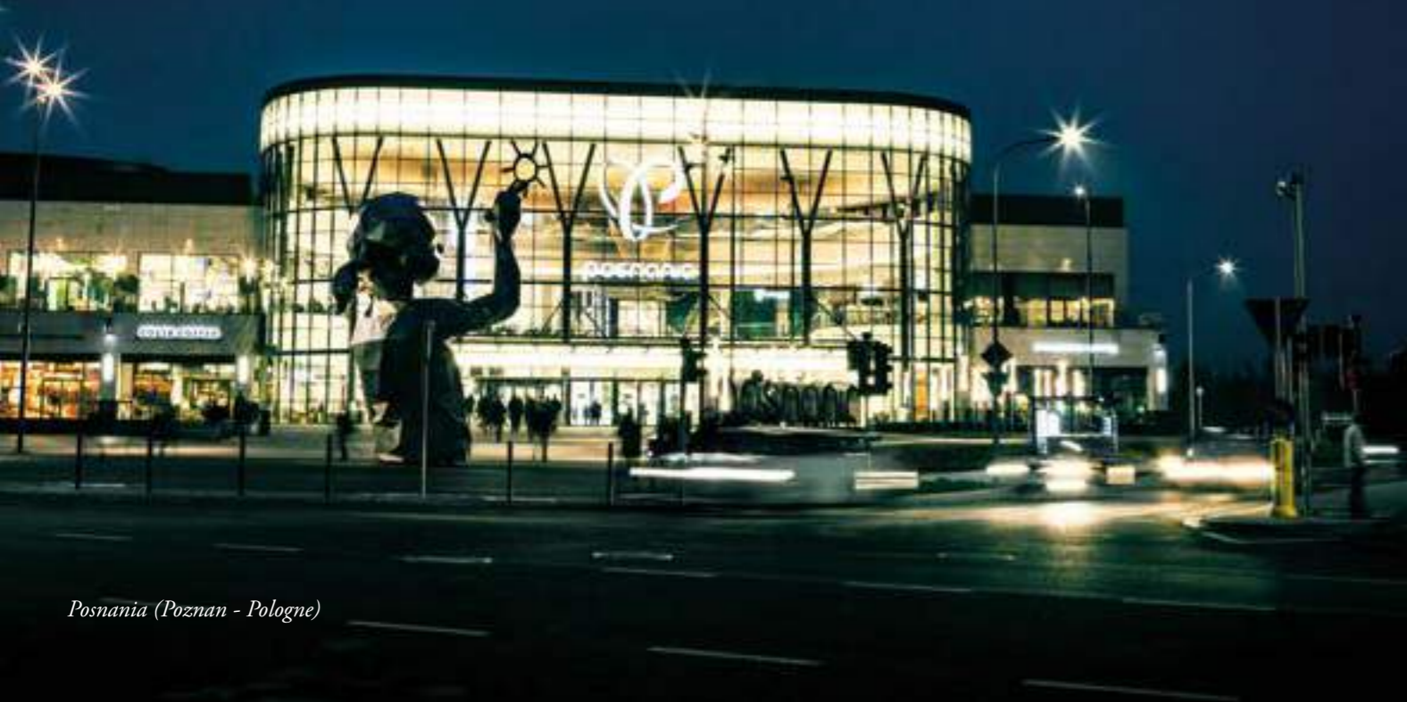
Posnania (Poznan - Pologne)

Apsys Lab, notre incubateur d'idées, réunit des passionnés d'innovation qui analysent l'ADN des lieux et anticipent les tendances émergentes, façonnant ainsi la ville, le commerce et l'expérience clients de demain.