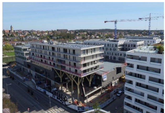
Muse, avril 2017

La priorité est donnée depuis le début du chantier aux entreprises de la région.